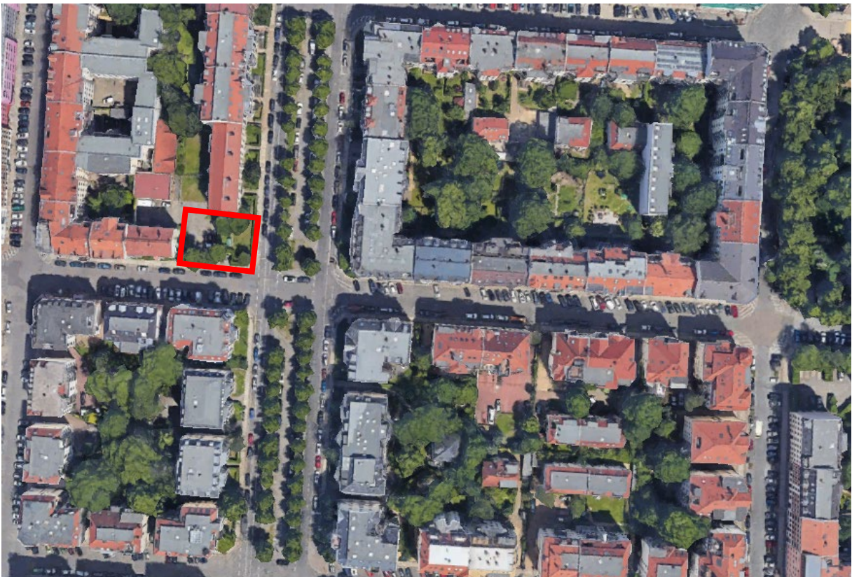
Abb. 2: Eckgrundstück Weidenstraße 100 mit näherer Umgebung